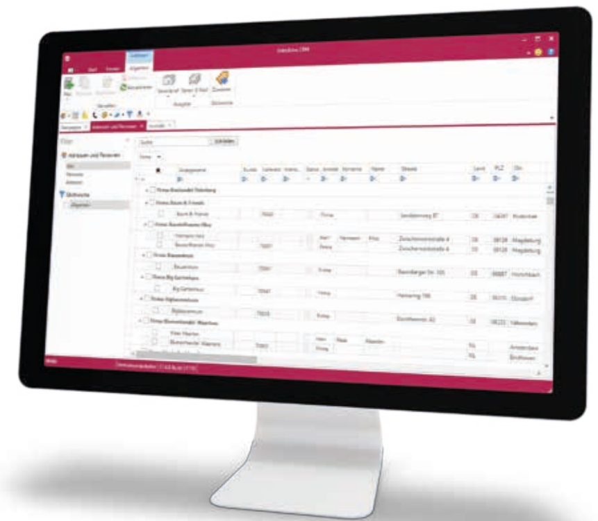
CRM - Adressen und deren Kontakte schnell im Überblick

Planen und steuern Sie Ihre Vertriebs- und Marketingaktivitäten indem Sie einen prüfenden Blick auf Ihre qualifizierten und unqualifizierten Verkaufschancen werfen. Mit dem Verkaufstrichter werten Sie per Mausklick die Verkaufschancen nach Mitarbeitern oder einzelnen Vertriebsphasen aus und erhalten so eine Vorschau auf mögliche und künftige Aufträge sowie zu erwartende Umsätze.