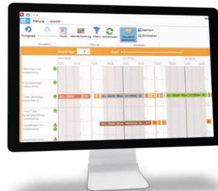
Die zeitliche Abfolge der geplanten Verkaufträge sehen Sie hier in einer Übersicht.

Beim manuellen Verschieben per Drag-and-Drop oder bei Anpassung eines Arbeitsschritts an erfasste Ist-Werte, kann die in der Zukunft liegende Planung automatisch so angepasst werden, dass die durch die Anpassung entstehenden Überlasten sofort wieder beseitigt werden.